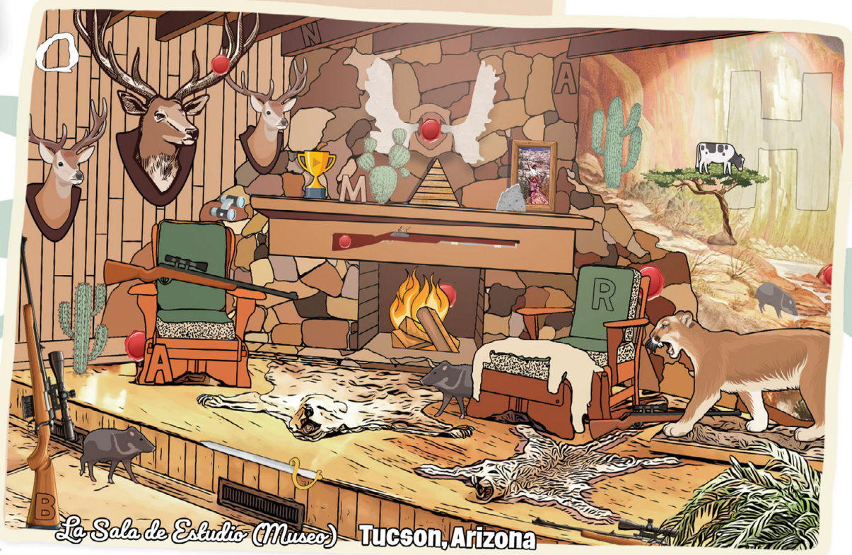
La Sala de Estudio (Museo) Tucson, Arizona