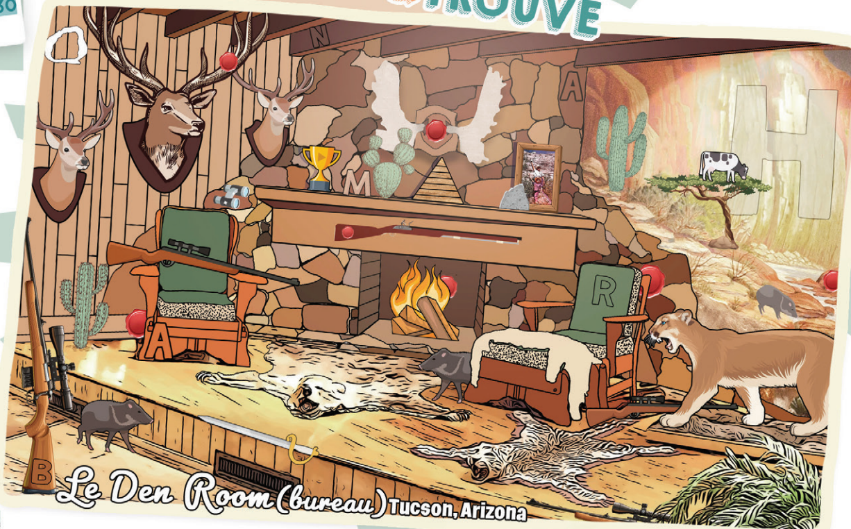
Le Den Room (bureau) Tucson, Arizona