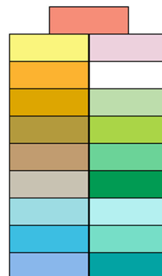
Cartela de cores