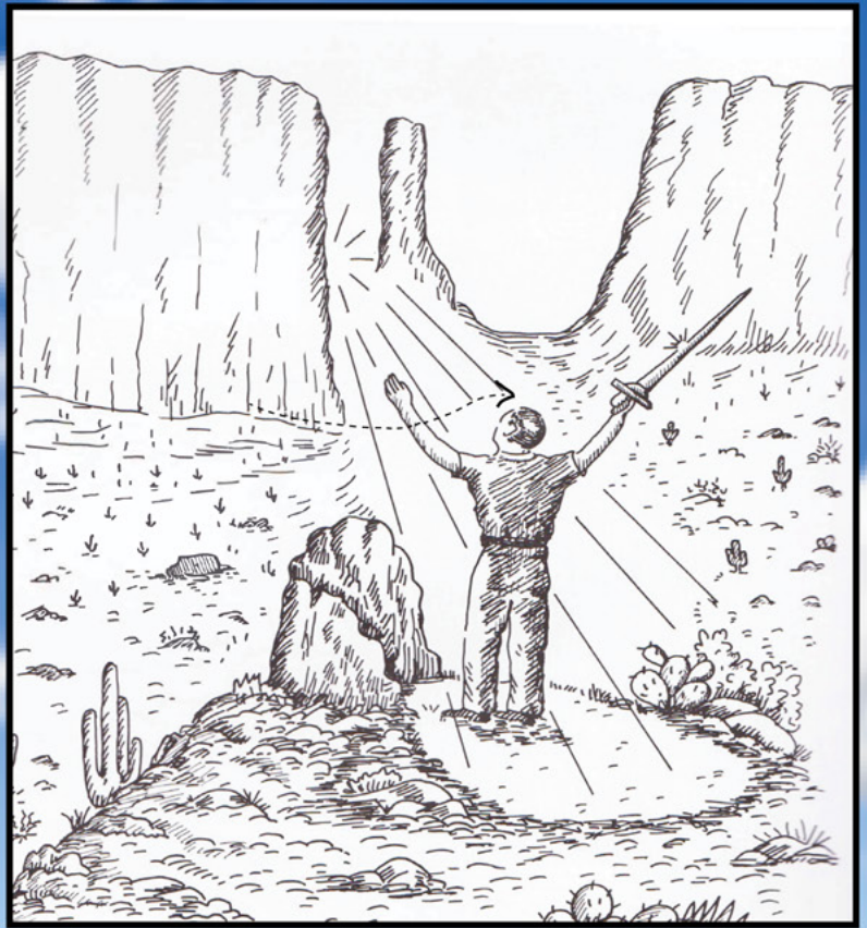
Cañón _____, Arizona.

“ESTA ES LA ESPADA DEL REY”. “NO TEMAS, ESTE ES EL TERCER JALÓN”.