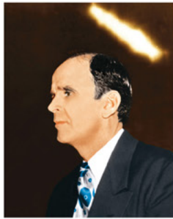
Pièce 2 :