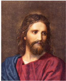
Pièce 1 :