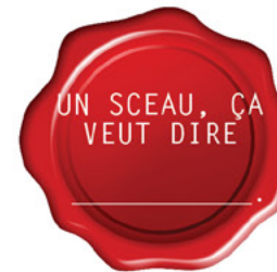
Pièce 6 :