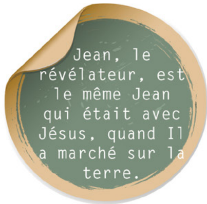
Pièce 4 :