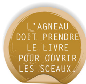
Pièce 5 :